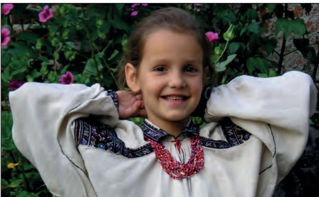
Рис. 2. Дівча в монистах

Найдавнішими творами з бісеру стали накладні прикраси одягу, які носили на голові, шиї та грудях. Бісерними стрічками також оздоблювали парубочі та дівочі святкові й весільні головні убори. Більшість бісерних прикрас мала орнаментальну структуру. Винятки складали мониста (разки бісеру) та трясунки (пучки волосин з набраним на них бісером). Загалом, у XIX ст. побутувало 11 типів накладних прикрас: мониста, стрічковий ґердан, стрічковий ґердан з підвісками, однодільна силянка, обплетені мониста, об'ємна плетінка, розетковий ґердан, хрещатий ґердан, кутовий ґердан, пояс, трясунки. Багате типологічне розмаїття творів – одна з особливостей мистецької традиції бісерного оздоблення народної ноші українців (рис. 2, 3, 4, 5) [3].