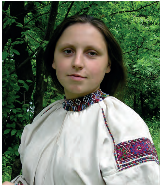
Рис. 3. Дівчина в стрічковому ґердані з підвісками

Відомий дослідник української орнаментики Михайло Селівачов у монографії «Лексикон української орнаментики» переконливо довів, що всі мотиви традиційної орнаментики українців мали полісемантичний зміст, який зводився до захисту від злих сил, магічної стимуляції фертильності, оберігання життя і продовження роду [4]. Враховуючи, що більшість типів виконаних з бісеру оздоб мали орнаментальну структуру, стає зрозумілим широке зацікавлення українців бісерними прикрасами як оберегами, наділеними життєдайною магією.