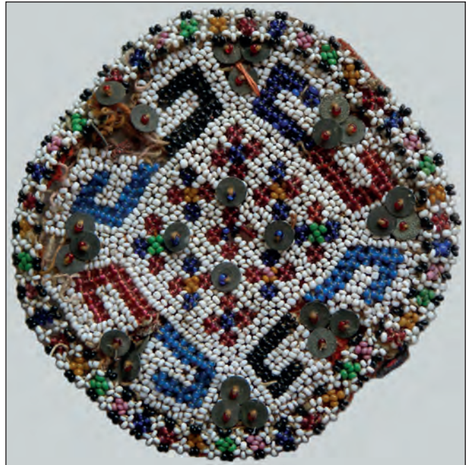
Рис. 13. Квітка (прикраса головного убору нареченого). Кінець XIX ст., Північна Буковина. Приватна колекція І. Снігура

Уважно споглядаючи та вдумливо аналізуючи бісерні прикраси XIX ст. з різних куточків України, можна зробити ще не одне відкриття. Знайомство з безцінними пам'ятками здатне відкрити кожному небайдужому українцю могутній потенціал народженої понад два століття тому мистецької традиції, тим самим сприяючи сучасному розвитку бісерних оздоб народної ноші. ■