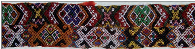
Рис. 9. Стрічкові гердани для головного убору нареченої. Фрагмент. Рубіж XIX–XX ст., Північна Буковина. Приватна колекція І. Снігура

Зокрема, найбільшою варіативністю графічного вирішення вирізнялися мотиви буковинських і покутських композицій. Для прикладу: на весільних головних уборах буковинців побутовув об'єднуючий символіку жіночого і чоловічого начала знак родючості – ромб, увінчаний ріжками [5]. Середину такого ромба заповнювали особливо вишукано – часто усередині ромба розміщували скісний хрест, що ділив його на чотири частини, які в свою чергу теж могли мати різне багатоелементне вирішення (рис. 9).