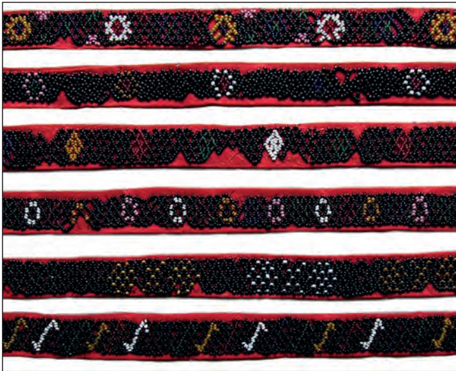
Рис. 11. Стрічкові гердани. Фрагменти. Кінець XIX ст., Західне Поділля. Музей етнографії та художнього промислу (м. Львів)

Невід'ємним складником локальних особливостей бісерних оздоб був їхній колорит. Так, західноподільські бісерні прикраси XIX ст. вирізнялися чорним тлом, на якому розміщували тонко окреслені одно-, рідше – двоколірні мотиви, виконані білими, темно-вишневими, темно-синіми, темно-зеленими, теракотовими намистинками (рис. 11) [6]. А ось покутянки у XIX ст. при виконанні бісерних прикрас використовували білу, темно-вишневу, темно-зелену і теракотову барви [7]. До традиційних кольорів майстрині Західного Поділля та Покуття могли долучати й інші барви, напр., рожеву, світло-зелену, жовту (рис. 8, 12).