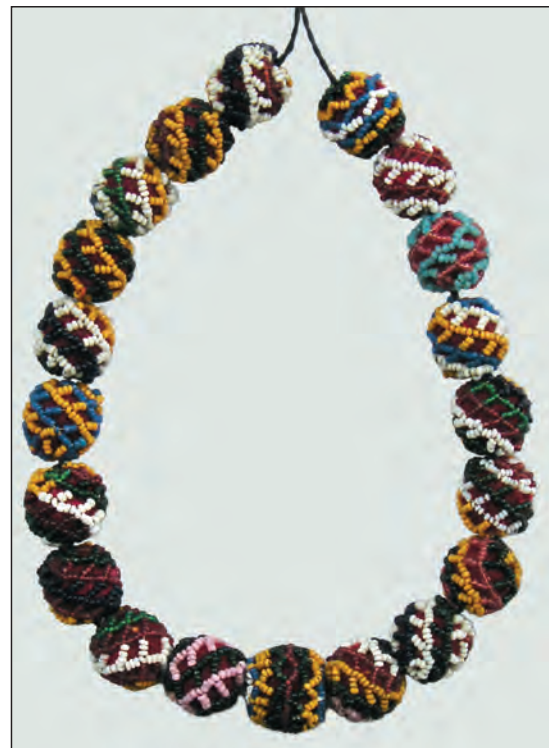
Рис. 4. Обплетені мониста. Кінець XIX ст., Покуття. Музей етнографії та художнього промислу (м. Львів)