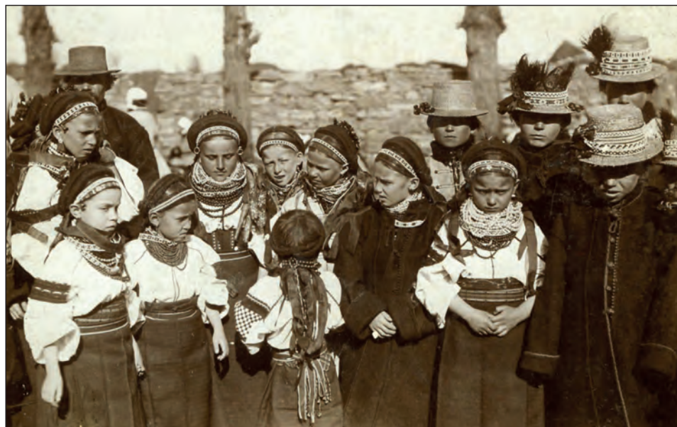
Рис. 1. Театральний гурт після прем'єри дитячої опери «Коза-дереза». 1892 р., с. Тишківці Городенківського р-ну Івано-Франківської обл. (Покуття)

Майстрині з високим рівнем етнічної свідомості в композиціях своїх творів прагнуть відтворювати національну орнаментику, проте не завжди вдало. Основною причиною промахів є брак знань. Упродовж 1950–1970-х рр. з низки причин у багатьох містах і селах України традиції бісерного оздоблення народної ноші творчі практики припинилися; не обійшлося без втрати значного пласту автентичного мистецького спадку та досвіду. Цінним джерелом для сучасної творчості є відомості про творчість майстрів XIX ст. як часу становлення основних рис орнаментики бісерних прикрас українців.