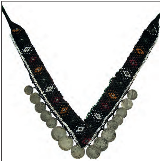
Рис. 5. Кутовий гердан. Кін. XIX ст., Західне Поділля. Національний музей у Львові ім. Андрея Шептицького

Традиція бісерного оздоблення народної ноші українців, що народилася відносно пізно, успадкувала архетипи національної орнаментики, які пройшли тривалий розвиток у художній мові архаїчних видів народного мистецтва. Зокрема, основою для творчості з бісером стала орнаментика тканих та вишитих компонентів народного одягу. Основні відмінності між графічним рішенням орнаментальних мотивів обумовлювалися техніками виконання.